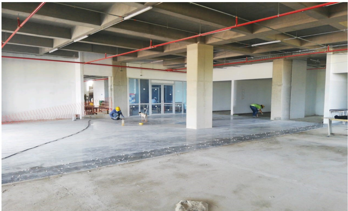
INSTALACION DE PISO CAFETERIA