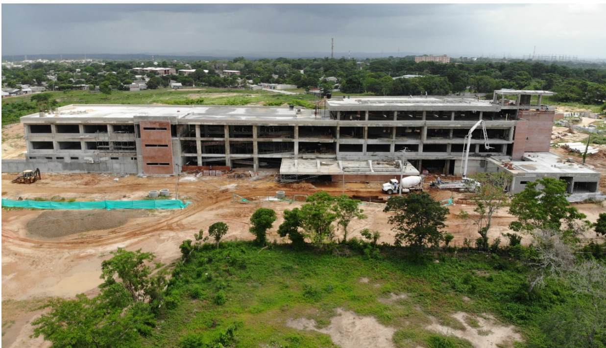
FACHADA PRINCIPAL SEDE CENTRO UNIVERSIDAD DEL ATLÁNTICO - SABANALARGA

A continuación, se evidencia el estado de ejecución de la Edificación construida, en la cual de los 12.500 M2 cubiertos de construcción, ya se encuentran más de 11.000 M2 cubiertos terminados y en fase de detalles.