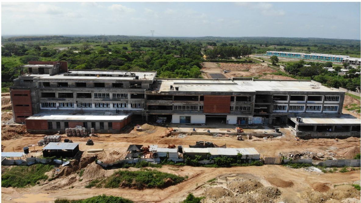
FACHADA POSTERIOR SEDE CENTRO UNIVERSIDAD DEL ATLÁNTICO - SABANALARGA