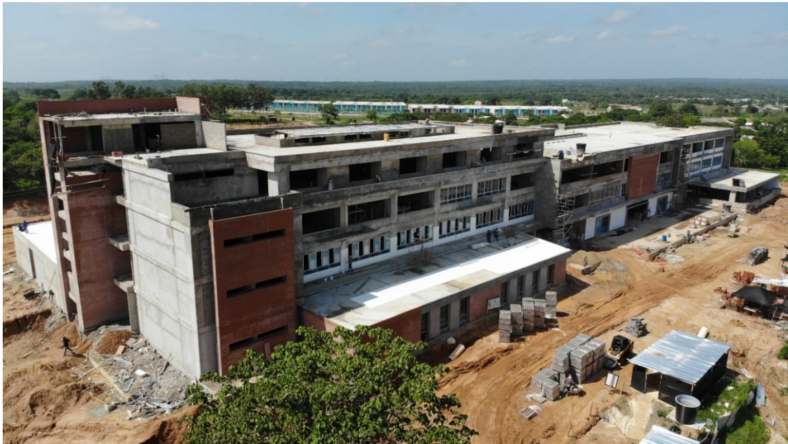
FACHADA POSTERIOR SEDE CENTRO UNIVERSIDAD DEL ATLÁNTICO - SABANALARGA