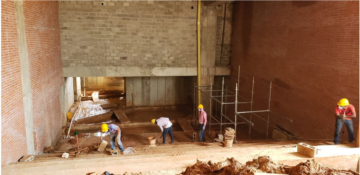
AULA MAYOR CON CAPACIDAD PARA 164 PERSONAS