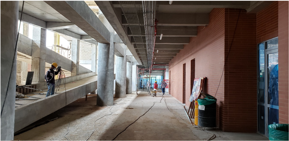
PASILLO PRIMER PISO