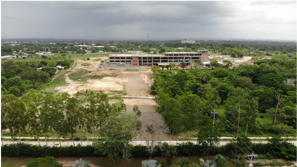
VÍA DE ACCESO DE LA ENTRADA PRINCIPAL DESDE LA CRA 19