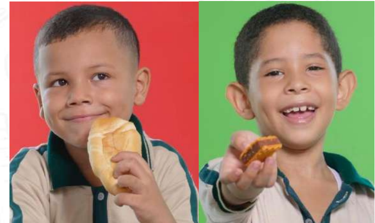
PROGRAMA DE ALIMENTACIÓN ESCOLAR