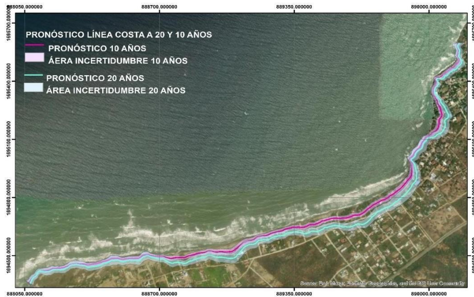
Fuente: Proyección línea de costa a 10 y 20 años.

A partir de la información analizada y conociendo los datos de erosión y sedimentación en el sector de playas de Santa Verónica y Salinas del Rey, se obtuvo una proyección del posible comportamiento del borde costero en el sector a 10 y 20 años respectivamente. En ambos casos se evidencia un retroceso de la línea de costa del área de estudio de hasta 100 m a partir de la línea de costa del año 2023.